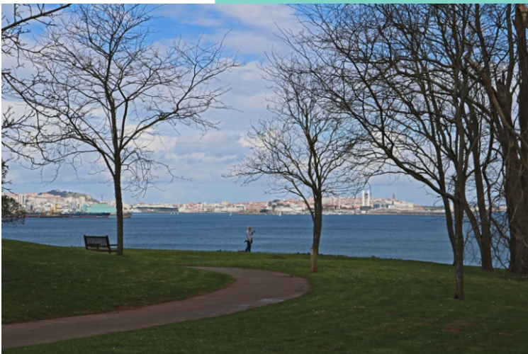
Parque de Galeras