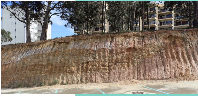
Lugar de Interese Xeolóxico “Depósitos de vertente en Santa Cruz (Oleiros)” Depósitos de gravas (seixos) de distintos tamaños formados no Cuaternario. Son testemuña de alternancia de períodos áridos e chuviosos.