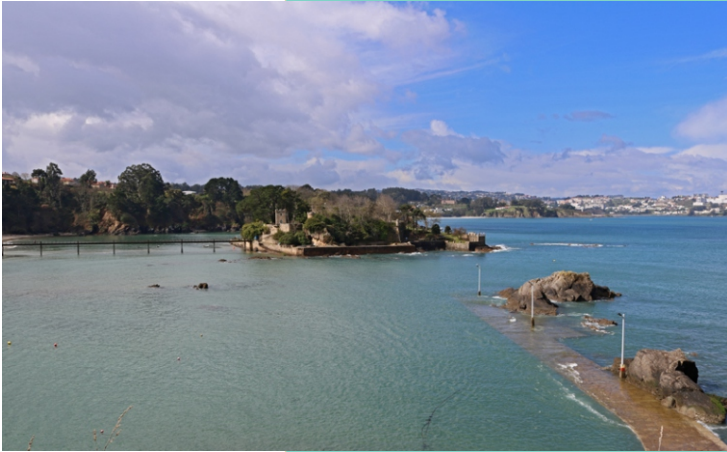
Badía de Santa Cruz co porto e a illa do Castelo