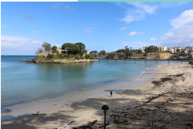
Praia de Santa Cruz