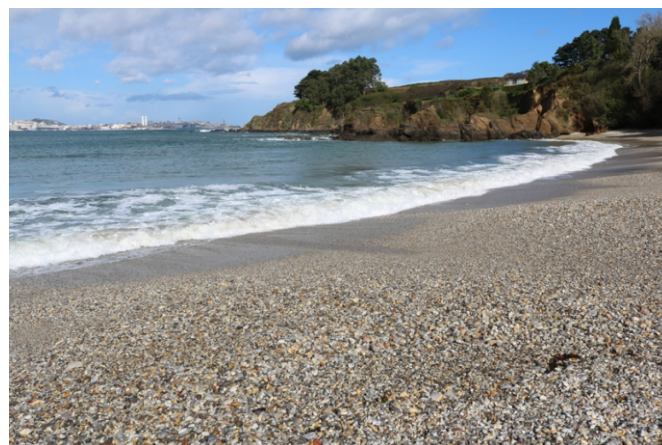
Praia de Naval. Entre as Puntas do Boi e do Corvo. Os sedimentos máis grosos son coios de seixo procedentes da erosión do terreo da contorna.