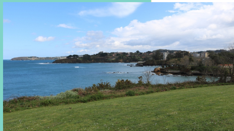
Vista desde o Parque de Galeras sobre a costa de Oleiros