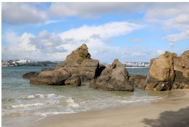
Rochs na praia de Naval