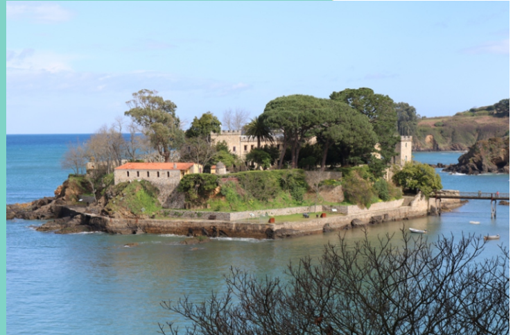
Castelo de Santa Cruz